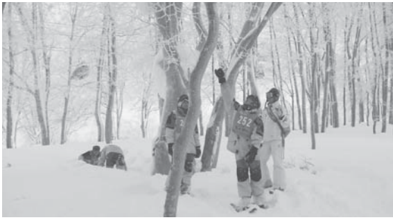
▲六年生で自然散策したブナ林をスノーシューで

一日目は雪国体験の一つとしてCORONと呼ばれる自然の「プロ」による案内で、一昨年夏に自然散策したブナ林をスノーシュー(西洋かんじき)を