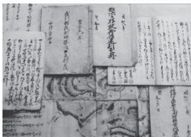
▲稲城市に現存する江戸時代の 古文書