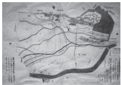
▲江戸時代の村絵図

中心にした展示を行っていま す。このたび、一部資料の展示 替えを行いました。新しくした 展示では、江戸時代の古文書を 写真パネル等で紹介します。ぜ ひご覧ください。 ▽会場 城山体験学習館・郷土 資料室コーナー ▽新展示品 写真パネル、説明 パネル、市内から発見された古 文書の概要など ▽問合せ 生涯学習課