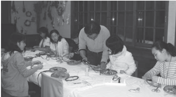
▲宿でのふれあい体験(リース作り)

この期間中、生徒たちは宿のオーナーやその家族の方々と交流を深めながら、小学校のときお世話になったオーナーのこ