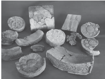
▲東京都有形文化財に指定された 瓦谷戸窯跡出土品

奈良時代の稲城市域は、どの ような様子だったでしょうか。 当時の稲城周辺の地域は、武蔵 国の多摩郡に属していました。 武蔵国は現在の東京都と埼玉 県、そして神奈川県、川崎市・ 横浜市の大部分を占める大國で した。稲城市域は、この武蔵国 のなかでも国分寺(現国分寺市)