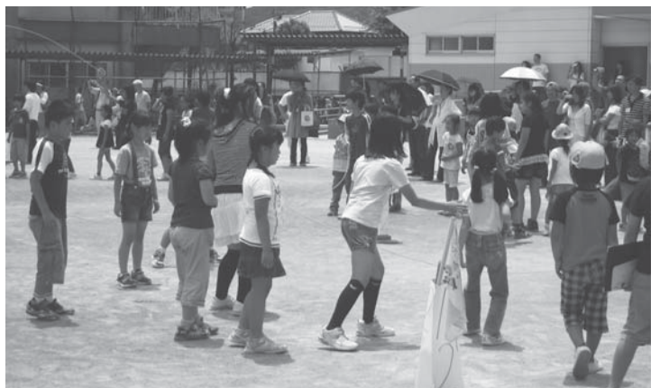
▲ジャンプ大会 1年生もとべたよ

そのうち、ジャンプ大会とカルタ大会は、各学年のメンバーで構成された縦割り班での活動でした。ジャンプ大会では、六年生が優しく大縄に入るタイミングを下級生に教え、跳べなかつた一年生も跳べるようになりまし。地域や保護者の方も縦割り班のよさに感心しておいでした。カルタ大会でも、上級生が下級生の面倒をよくみ、伝統行事