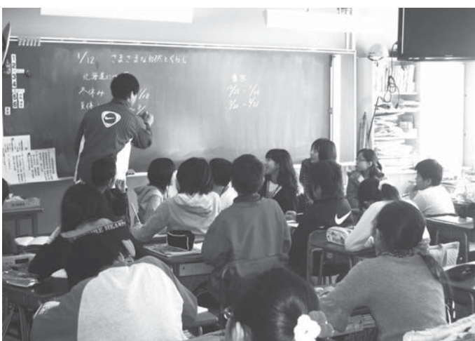
▲それぞれの地域の違いを発表しています

五年生の中から希望者を募り、夏休みに大空町を訪問しています。交流20年にあたる今年度は、25名の児童が8月19日から21日まで訪問しました。すでに二期が始まっている大空町立小学校への訪問や農業・水産業等の体験、一般家庭への宿泊等を通して北海道の自然に触れたり、