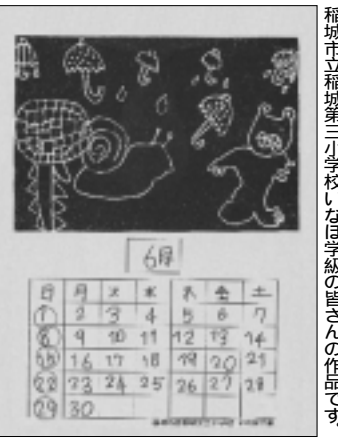
稲城市立稲城第三小学校いなほ学級の皆さんの作品です。

編集・発行 稲城市教育委員会 教育部 生涯学習課 〒206-8601 稲城市東長沼2111 電話 042-378-2111 FAX 042-379-3600