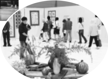
▲芸術祭の展示(昨年度)

▷主催 稲城市芸術文化団体連合会 (芸文連事務局：生涯学習課内 内線633 ※午後1時以降)