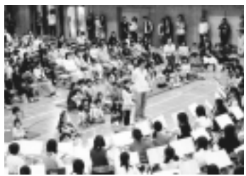
▲親子で楽しむオーケストラ