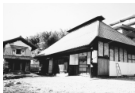
復原事業が行われた古民家