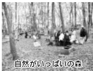
自然がいっぱいの森

ふれあいの森は、豊かな自然が残された坂浜地区の丘陵にあり、野外活動やレクリエーションを楽しめる施設です。ジェットケープルなどの遊具もあり、カマドを使ってバーベキューをすることもできます。利用料金は一切かかりません。食材や飲み水、薪をご用意頂ければ、お皿などは貸出して自然がいっぱいの森 3月から6月までの土・日・祝日と、9月から11月までの土・日・祝日に一般開放を行います。申込不要ですので、ぜひ気軽に遊びにきてください。 開放時間 午前9時～午後4時 注意事項 オートバイ、自転車、カラオケ、ラジコン、エアガン、花火、野草摘み、虫捕り、ペットや酒類の持込みなどはできません。管理人の指示に従ってください。 来月(4月15日号)で詳細をご案内する予定です。 問合せ 生涯学習課