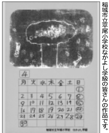
稲城市立尾小学校なかよし学級の皆さんの作品です。

ジュニアワーカーの活動支援などを通じて、地域活動に係わる楽しさ、面白さを体験し、社会活動への参加を促します。 対象 16歳～26歳 内容 ゲーム指導やハイキング、キャンプなど青少年活動のリーダーとしての技能を磨く。 参加費 夏季研修・宿泊研修時に宿泊費等が必要になります。 期日 4月22日(日)(開講式)から毎月1～2回程度 会場 市内体育館やふれあいの森、小菅村等 申込み 生涯学習課の窓口か電話にてお申込みください。 申込期限 4月20日(金)問合せ 生涯学習課