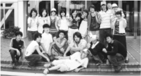
▲昨年のワーカーの皆さんです!

天候不良、市の主催事業(イベント、作業)などの都合により、一般開放を中止する場合がありますのでご了承ください。 デイキャンプ、サマーキャンプによるご利用については、10名以上の市内在住・在勤者の子どもを含むグループまたは青少年のグループに限らせていただきますのでご了承ください。 サマーキャンプの予約は6月18日から受付開始。(ただし、日程については青少年育成地区委員会による地区キャンプが優先となります。)