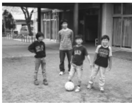
▲仲良く遊んでいます

子どもを守ろう」と一体となって活動している現状から、指定校制を推す意見が多く出されました。