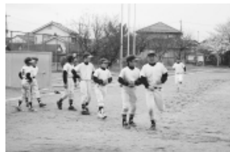
▲練習で良い汗を流しています

学区制には、学校選択制と指定校制があり、それぞれの内容について意見が出されました。学校選択制は、都内や多摩地区で一部実施されていますが、実施経過年数が少ないことから制度の課題など具体的に明確化されていないため、学校選択制を採用するまでには至りませんでした。