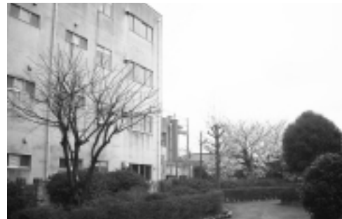
▲第七小学校の校舎を増築します

矢野口2284番地の11に建設予定である400戸以上の集合住宅地(コカコーラ工場跡地)は、現在第一小学校学区ですが、通学距離が第七小学校に近いことや学区にあること。また、第一小学校については、平成23年度には現在の収容規模では普