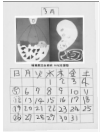
稲城第三小学校いなほ学級の生徒の作品です。

編集・発行 稲城市教育委員会 教育部 生涯学習課 〒206-8601 稲城市東長沼2111 電話 042-378-2111 FAX 042-379-3600