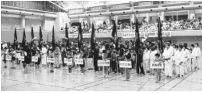
▲第34回大会 21種目 約6,200人の市民が参加

市民の体位向上とスポーツ振興を目的とした稲城市スポーツ大会が、今年も市内体育施設他で開催されます。皆さんふるってご参加ください。 ※申込み・参加費など詳細については、各競技の連絡先に確認してください。