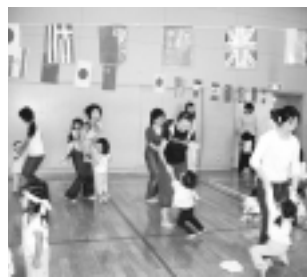
▲平成18年度運動会のようす

ただきます。土曜の昼下がりに、楽しい一時をお過ごしください。待ち合わせは「公民館」で！ 期日 3月24日(土) 時間 午後2時～3時半 会場 城山文化センター 対象 市内在住・在勤・在学の方 定員 50名(申込順) 入場料 無料 申込・問合せ 城山公民館 今回、映画の上映はありません。