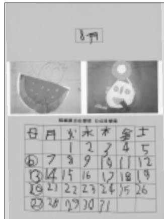
稲城第三小学校いなほ学級の皆さんの作品です。

編集・発行 稲城市教育委員会生涯学習課 〒206-8601 稲城市東長沼2111 電話 042-378-2111 FAX 042-379-3600