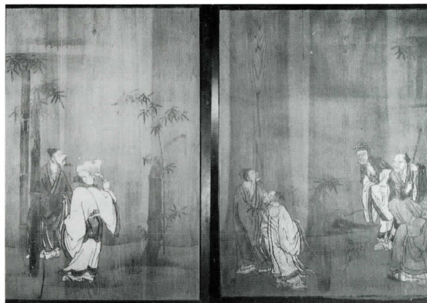
竹林七賢図（八王子市・永林寺蔵）