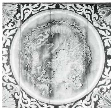
飛天図の両わきに描かれた龍の図