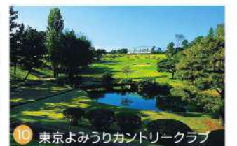
10 東京よみうりカントリークラブ