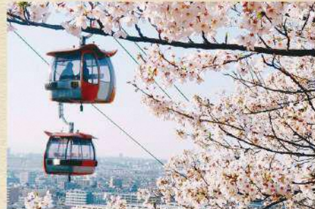
14 ゴンドラの桜じゅうたん

多摩川に沿って続く、多摩川原橋からは政橋までの堤がサイクリングコースとして整備されており、その内1.7kmに約130本の桜が植えられています。