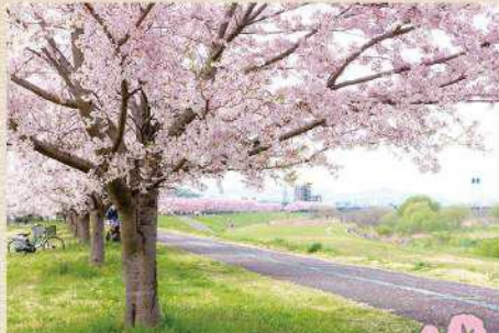
13 多摩川堤の桜並木

約2kmの三沢川沿いには桜の木が植えられていて、春夏秋冬、季節の彩りを感じることができます。春には隣接する市役所周辺にて「三沢川桜・梨の花まつり」が開催されます。