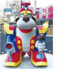
8 ヤッターワンモニュメント