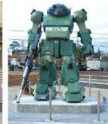
7 スコープドッグモニュメント