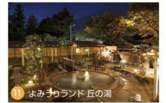
11 よみうりランド 丘の湯