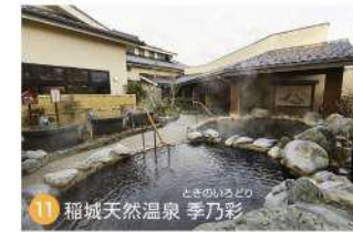
11 稲城天然温泉 季乃彩