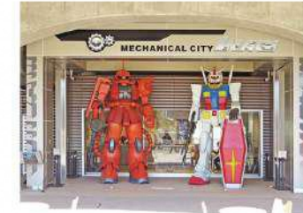
6 ガンダム&シャア専用ザクモニュメント