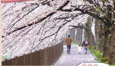
12 三沢川さくら回廊