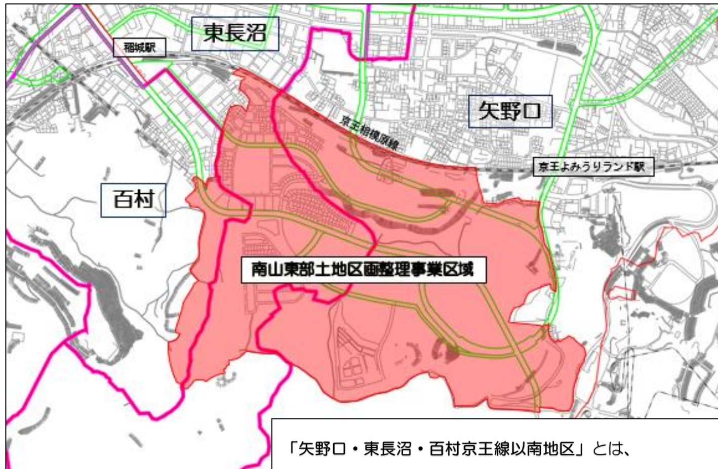
「矢野口・東長沼・百村京王線以南地区」とは、 南山東部土地区画整理事業区域及びその周辺のことです。

市では、わかりにくくなった住所を整理する「住所整理事業」を進めています。矢野口・東長沼・百村京王線以南地区では、南山東部土地区画整理事業が進んできましたので、併せて南山東部土地区画整理事業区域及びその周辺の住所整理を検討していきます。