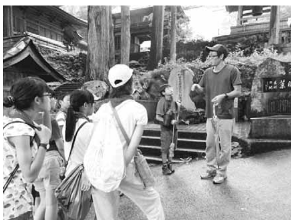
▶野沢温泉村の中を案内してもらいました

最後の5日目には、同じグループの学校やお世話になった民宿の方が集まって、お別れの会を行いました。野沢温泉村で過ごした時間が濃密だったからか、子供たちや民宿の方々が涙ぐむ場面もありました。子供も大人も心揺さぶられるほど感動したお別れの会は、素晴らしい思い出の一つになったことでしょう。