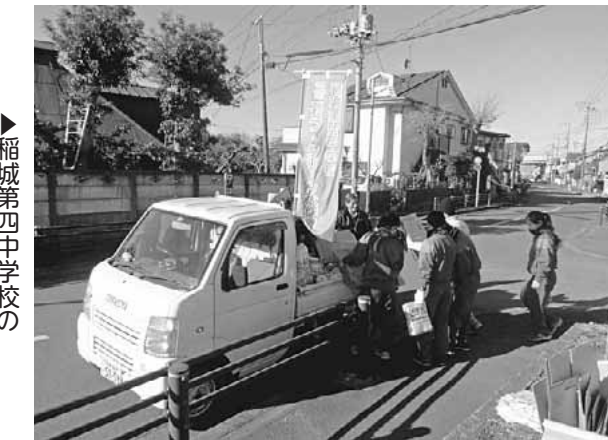
▶稲城第四中学校のユニセフ・クリーン大作戦