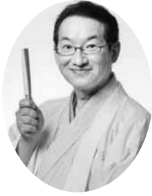
▲春風亭 昇太 笑点の司会でおなじみ、多方面で活躍中の人気者。