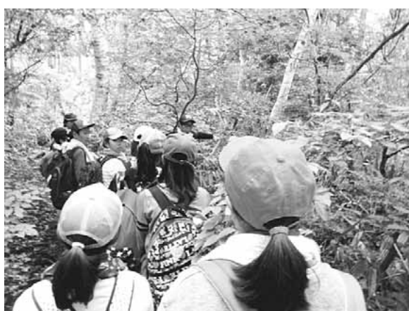
▶キャンプ場の周りをトレッキングし、ブナ林について教えていただきました

トに行かれたりする方もいらっしゃると思います。本事業が始まり12年を迎え、学校の行事以外のつながりが出来てきたことも、大きな成果です。 このように、野沢温泉村宿泊体験学習は、稲城市の学校教育の特色ある取組として、未来の担い手である子供たちに、豊かな情操を育むと共に、心のよりどころとなる貴重な体験学習の機会となっています。