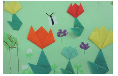
稲城第一小学校4組さんの作品