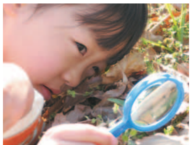
▲虫眼鏡で大地に大接近しよう

橋脚などに引っかかり、用水路が詰まって水が氾濫し、水害事故の原因になります。また、汚水を流すと農産物の収穫ができなくなり、農業に支障を来します。