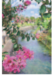
「大丸用水の百日紅」