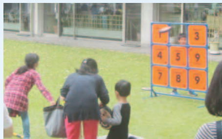
フライングディスク、ストラックアウト

体力テストや各種スポーツの指導など、様々なイベントを実施します(下表参照)。体育の日に、皆で体を動かしましょう。親子野球教室、トランポリン体験会の参加者募集は、生涯学習だより「ひろば」9月15日号または市HPをご覧ください。