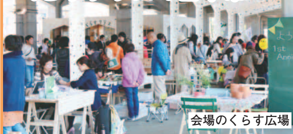
会場のくらす広場