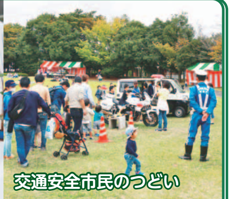
交通安全市民のつどい