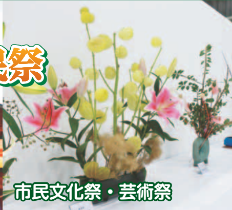
市民文化祭・芸術祭