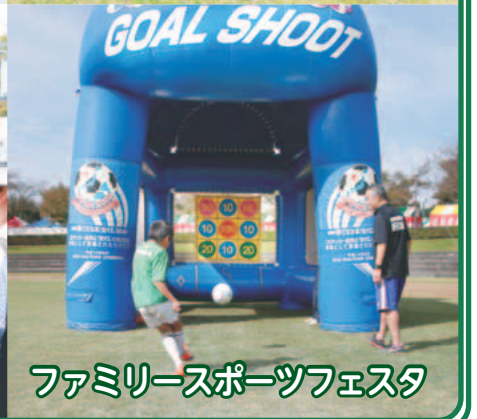
ファミリースポーツフェスタ