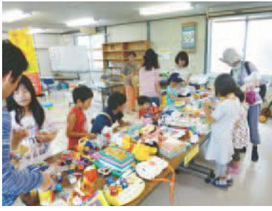
▲かえるポイントで「とりかえっこ」

子どもたちが使わなくなったおもちゃを持ち寄り、「かえるポイント(世界共通の子ども通貨)」を使い、欲しいおもちゃと「とりかえっこ」