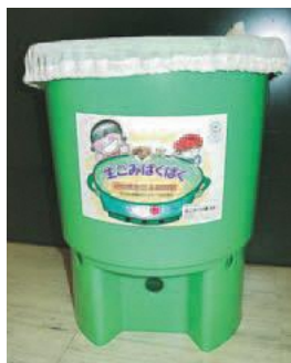
◀生ごみ減容器「くうたくん」