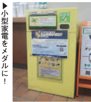
▶小型家電をメダルに!