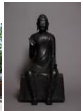
国宝「銅造釈迦如来倚像」