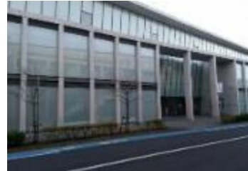
東京アートミュージアム