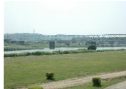
多摩川緑地公園と花火大会

「多摩川」は、水と緑の癒しスポットとして、週末には多くの市民の憩いの場となっているほか、例年夏には市内外から約35万人の来客で賑わう花火大会が開催され、夏の風物詩となっています。