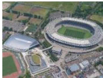
味の素スタジアム

このように西部地域は文化・スポーツの拠点であり、特に2019年のラグビーワールドカップでは大きな賑わいを見せました。また、新選組局長の近藤勇の生家跡があります。