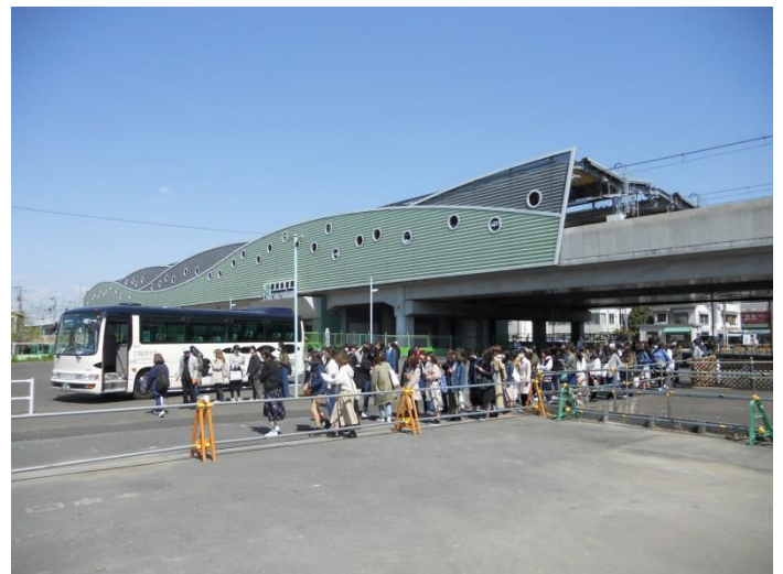
(写真①) 駅南口稲城長沼駅前通り線の現況