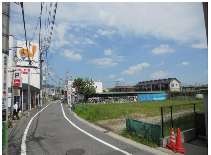
(写真③) 駅北側整地工事箇所