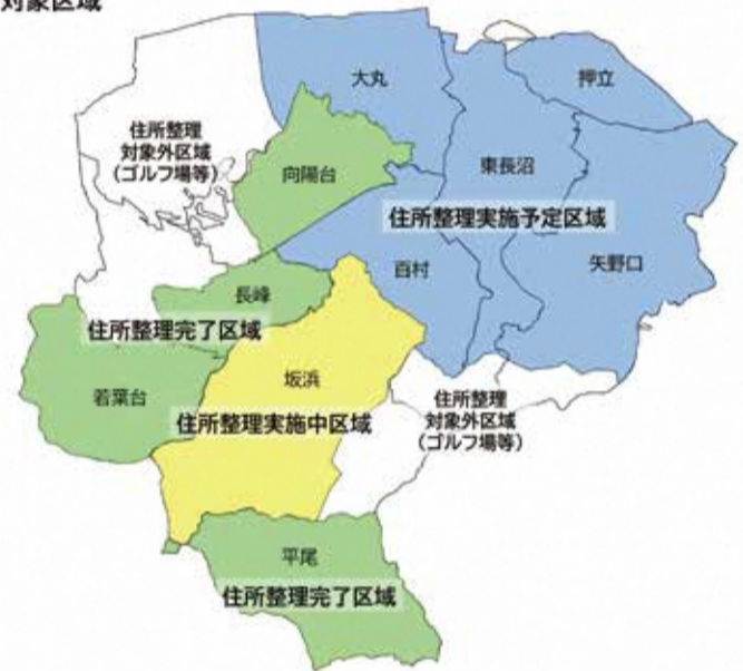
図:住所整理対象区域

住所整理事業は、町の区域をわかりやすく整理し、住所や所在地の番号を振り直す事業です。 市内全域を対象に大字単位で順次進められています。