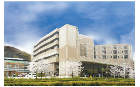
稲城市立病院(大丸1171)