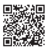
▲市立病院メディマップHP

※「キーワード検索」で、お住まいの「稲城市〇〇(地区名)」と入力しても、近くの診療連携医療機関を検索できます。