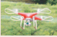
▲市所有のドローン