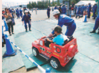
▲ミニ消防車乗車体験