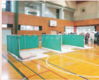
▲避難所設営運営訓練