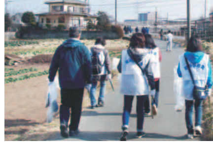
▲私たちの手で街をきれいにしましょう

先問地域包括支援センターこうようだい ☎370・0040 家族介護教室 知ってほしい介護のコツ「認知症編」 対介護をしている家族、関心のある方 日10月27日(金) 時午後2時～3時30分 場福祉センター2階 定20人(申込先着順) 申電話(10月2日(月)～) 先問地域包括支援センターエレガントむら ☎379・5500 新規購入のお知らせ 東京都シルバーパス 満70歳以上の都民の方が、申し込みにより都営交通・都