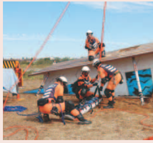
▲倒壊家屋救出救助訓練