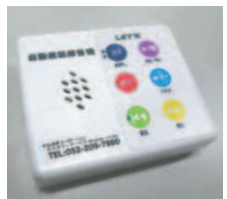
単取り付け 自宅の電話に簡