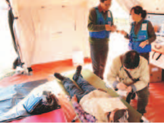
▲医療救護連携訓練