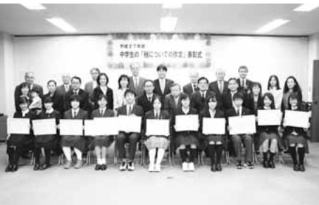
▲受賞された皆さん