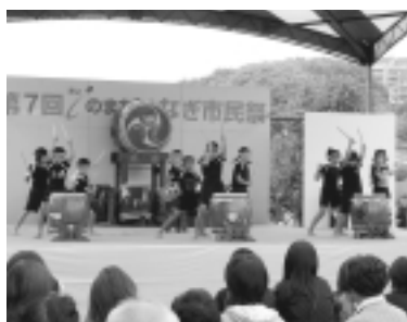
迫力満点！和太鼓コンテスト

申し込み方法などの詳細は、広報いなぎ9月15日号でお知らせします。 問い合わせ 協働推進課協働推進係