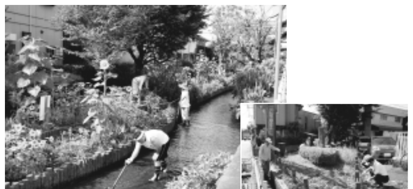
第35回環境美化市民運動(7月26日・市内) 各地区の自治会などの代表者で構成される推進本部が中心となって、道路や水路、公園、その他公共の場のごみ拾いや草刈りなどの清掃が、市内一斉に行われました。