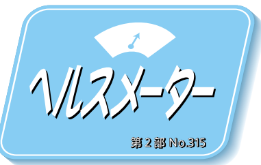
傷の治しかた、今と昔

10時30分 会場 保健センター 内容 歯科健診・個別相談(食事や歯みがきの事など) 持ち物 母子健康手帳、歯ブラシ、コップ、ハンドタオル 申し込み方法 記入例を参照(表面にも、歯科健診申込と明記)のうえ、はがき、封書、持参のいずれかの方法で申し込んでください。 申込期限 8月28日必着