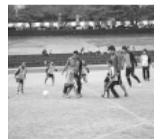
楽しく体を動かしませんか

ファミリースポーツフェスタ部門 24日(土)・25日(日) 参加型サッカーイベント、リレーマラソン、グラウンドゴルフ、ゴールシュート、スビッドガン体験コーナー、いなぎあるくマップ紹介コーナー