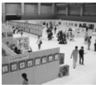
すばらしい作品がいっぱいです

第41回稲城市文化祭 第35回稲城市芸術祭 作品展示、お茶会 「文化祭ステージ部門」は11月21日(土)から23日(月・祝)に中央文化センターで、「囲碁大会」は11月22日(日)に、「俳句大会」は11月23日(月・祝)に地域振興プラザ(予定)で行います。 問い合わせ 生涯学習課社会教育係