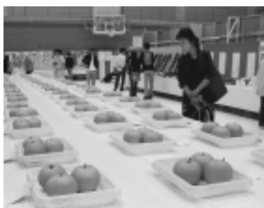
見に来てください！稲城の特産物

今年も市民を中心に企画・運営し、5つの部門それぞれが多彩な催しを行う「Iのまち いなぎ市民祭」を開催します。詳細や募集などは、随時広報いなぎでお知らせします。