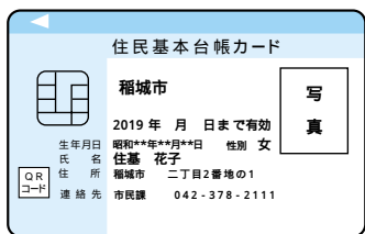
住基カード(顔写真付き)の例

また、身分証明書としての活用以外にも他の市区町村で住民票の写しが取得できたり、インターネットを利用した電子申請などでの申請者本人を証明する電子証明書の格納媒体としても利用できます(別