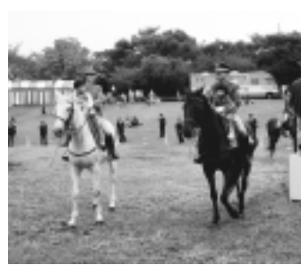
乗馬体験をしてみませんか

白バイ・パトカーの展示・撮影、交通安全写真展示、シートベルト体験 交通安全市民のつどい 期日 10月25日(日) 内容 警視庁騎馬隊による乗馬体験 問い合わせ 管理課交通対策係