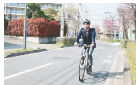
▲保険加入で万が一に備えましょう

す。3月中に保険への加入をお願いします。なお、現在加入している自動車保険やクレジットカード等に付帯する契約によっては、新たな保険に加入しなくても良い場合もあります。詳細は「東京都民安全推進本部」を閲覧ください。対全ての自転車利用者（未成年者はその保護者）、自転車を使用する事業者などを確認しよう！自転車安全利用五則