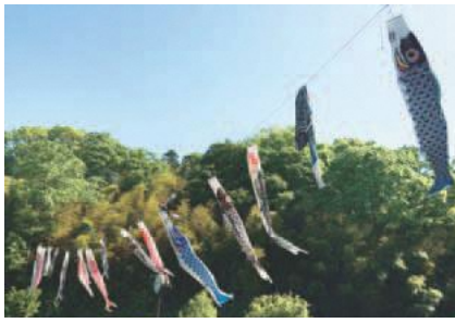
▲こどもの日に合わせて掲揚します