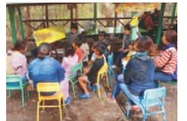
▲森のたからばこ(おはなし会)

午前9時～午後4時 ▷禁止・注意事項 ○野草摘み、飲酒、ペット同伴での入場、カラ オケなど他人の迷惑となる行為 ○天候不良や整備作業などにより、開放を中止 する場合があります。開放日などの詳細は、市 ををご覧ください。