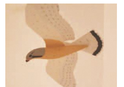
▲紙で作った鳥クラフト