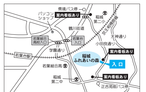
▲稲城ふれあいの森地図

◆共通事項 場稲城ふれあいの森(坂浜1307) ※多摩3・4・17号坂浜平尾線が暫定 開通していますが、小田良通り側の入 り口をご利用ください。 関係児童青少年課青少年係