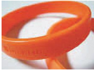
▲修了者にオレンジリングを差し上げます

認知症サポーターは認知症の正しい知識を持ち、認知症の方や家族を温かく見守る応援者です。認知症の方が安心して暮らせるまちづくりを目指し、養成講座を開催します。