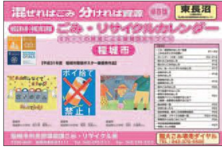
▲ごみの収集日・出し方などを掲載

令和2年度版の「ごみ・リ サイクルカレンダー」を、3 月上旬から各世帯・事業所に 1部ずつお届けします。 ※2世帯住宅で1部しか届い