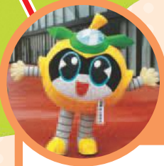
なしのすけ おすすめスポット

ペアテラス (東長沼516-2) は、稲城の美味しいお菓子が売っていたり、僕と写真を撮れるスポットもあるよ！