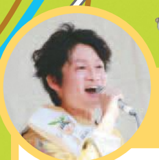
龍井さん おすすめグルメ

Café ROSSARD (百村525) の「海と森のガレット」は、まるやかな生地の上にサーモンマリネ、アボカドがトッピングされ、ほっぺたがとろけるほどに絶品です。