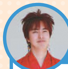
花枝さん おすすめスポット

京王よみうりランド駅付近から見る夜景は、思わず「きれい！」と声が出てしまうほどです。