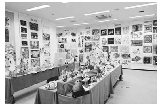
▲小学生の図画工作作品

稲城の子どもたちが、工夫し、力を発揮し、一所懸命仕上げた作品が勢ぞろいし、多くの来場の方々をお迎えしました。