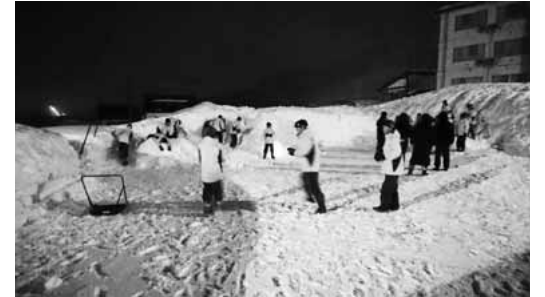
▲夜の雪原でのかまくらづくり