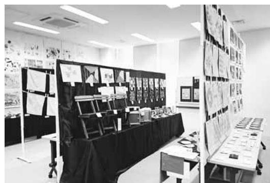
▲特別支援学級児童・生徒の作品