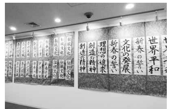
▲中学生の書初め作品