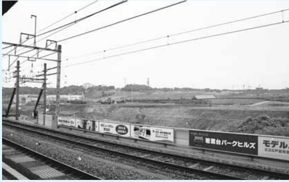
▲平成10年5月(若葉台駅より)

ほとんどが山林や畑だった多摩ニュータウンの造成前の風景と、開発中の平成10年から11年ごろの風景、現在の風景を比較し、若葉台の移り変わりを展示します。若葉台駅北側のiプラザギャラリーにて開催しますので、ぜひ現在の町並みと比べてみてください。 ▷期間 3月22日(水)～3月30日(木) ※3月27日(月)は休館 ▷時間 午前9時半～午後8時 ▷会場 iプラザ ▷入場料 無料 ▷主催 生涯学習課 ▷共催 iプラザ ▷問合せ 生涯学習課