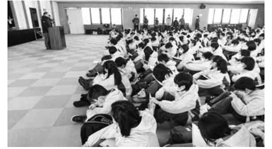
▲オリンピック講演会