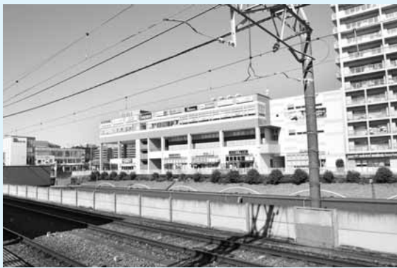
▲平成29年2月(若葉台駅より)