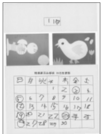
稲城第三小学校いなほ学級の皆さんの作品です。

編集・発行 稲城市教育委員会生涯学習課 〒206-8601 稲城市東長沼2111 電話 042-378-2111 FAX 042-379-3600