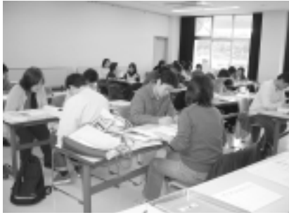
▲日頃の学習成果を発表します!