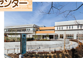
みどころ10 稲田公園

平成23年3月に開館した、屋内の温水プールやアーチェリー練習場などを備えたスポーツ施設です。施設提供のほか、各種スポーツ教室などを行っています。