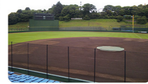
みどころ7 東京ヴェルディグラウンド

京王よみうりランド駅から、読売ジャイアンツ球場へ向う「よみうりV通り」には2009年当時、日本一となった巨人選手、監督、コーチの手形があり、応援に来た人を歓迎します。