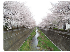
みどころ3 穴澤天神社

多摩川の支流で、鯉が泳ぎ、時にはカワセミを見ることもできます。春には川沿いの約320本の桜が咲き、市内外から写真を撮りに集まり、川沿いは賑わいをみせます。