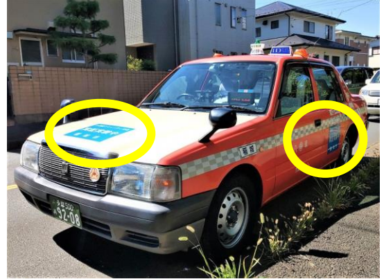
車両に青いシートを貼り、実験車両であることを示しました。