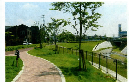
三沢川親水公園(矢野口榎戸地区)