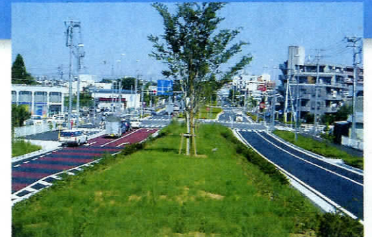
尾根幹線(百村地区)