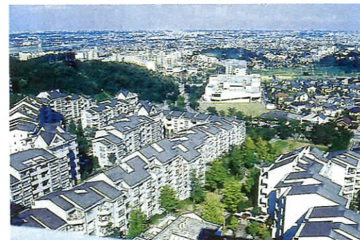
向陽台(多摩ニュータウン)