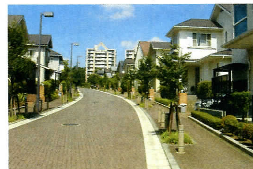
若葉台(多摩ニュータウン)