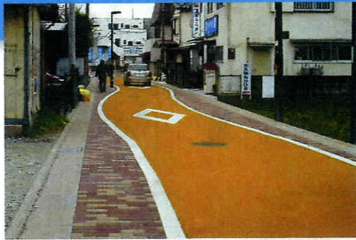
青渭通り(東長沼・大丸地区)