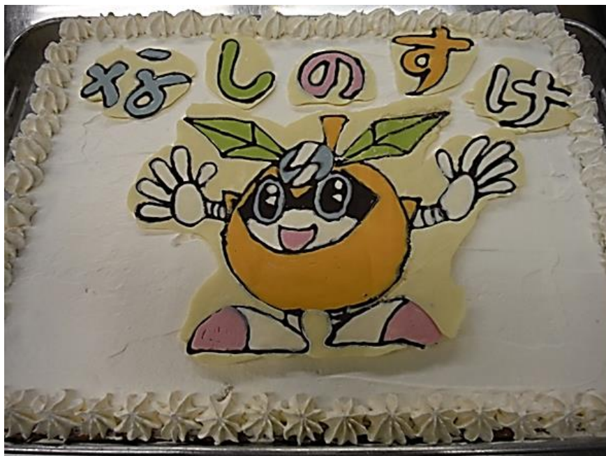
稲城市立第五保育園給食「なしのすけ お誕生日ケーキ」

バランスのとれた食事をおいしく・楽しく・感謝の気持ちで ～食卓に笑顔があふれるまち・いなぎ～