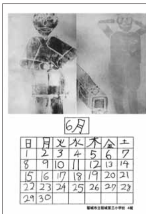
稲城市立稲城第三小学校4組の皆さんの作品です。

編集・発行 稲城市教育委員会教育部生涯学習課 〒206-8601 稲城市東長沼2111 ☎042-377-2121 042-379-0491