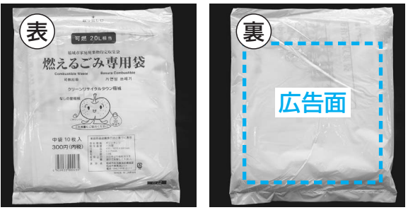
▲市内の各ご家庭で使用されています

測定地点 校庭または園庭 測定機器 日立アロカメデICAL社製 TCS-172B 測定日 平成24年11月26日(29日) 測定方法 30秒ごと5回の繰り返し測定による平均