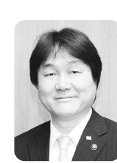
稲城市長 高橋 勝浩

そして次に多く寄せられましたのは、昨年の東日本大震災を受け、防災関係のご意見。ご要望でした。今年度の当初予算に計上した事業につきましては、着実に年度内に執行できるような努力するとともに、次年度以降も、防災面強化を図ってまいります。