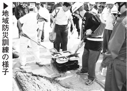
▶地域防災訓練の様子

昨年3月11日に発生した東日本大震災は、従来の災害の概念に収まらない未曾有の大災害でした。多摩直下地震など稲城市を襲う大規模地震に対して、より確かな備えを講じ、少しでも被害を少なくするためには、地域の防災意識の高揚として、自主防災組織による実践的な訓練を繰り返し行うことが大切です。 「いざ」という時すぐに行動できるよう「防災訓練」に参加しましょう。 今回はメイン会場となる稲城第五中学校の他に、市内3カ所の避難所指定施設で避難所運営訓練を実施します。 最寄りの公園等の避難場