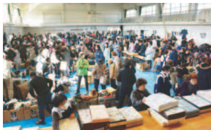
▲衣類や日用雑貨など様々な品物が販売されます