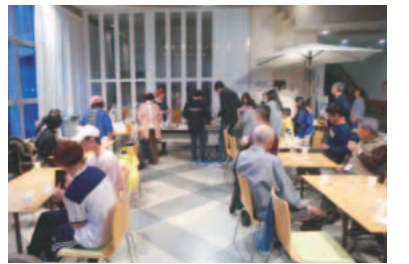
▲ホッとくつろげる居場所づくりをしています

※講演会開始前に、青少年健全育成活動にご尽力いただいた方を表彰する顕彰式典を行います。