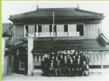
村役場での記念写真。1階が事務室、2階が村議会の議場として使われました。