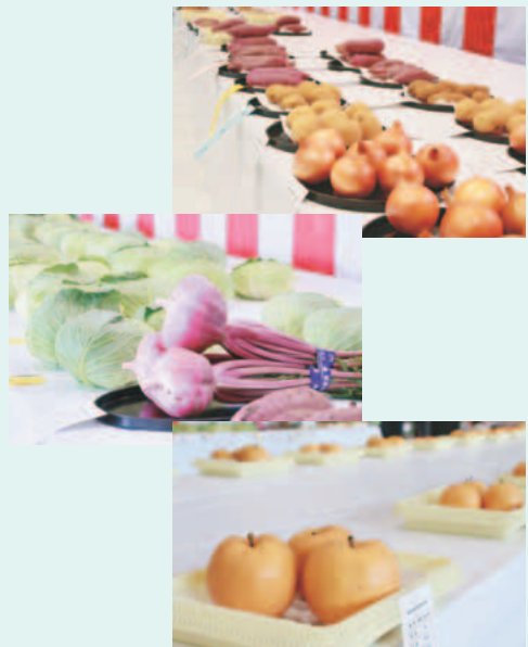
▲今年もたくさんの農産物が出品されました。