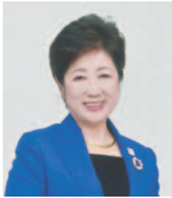
▲小池都知事も出席します

地域の高齢者・子育て支援など、多世代への支援を提供する都内初の施設「生活支援サービス拠点 向陽台」がオープンします。当日はオープニングセレモニーを開催します。