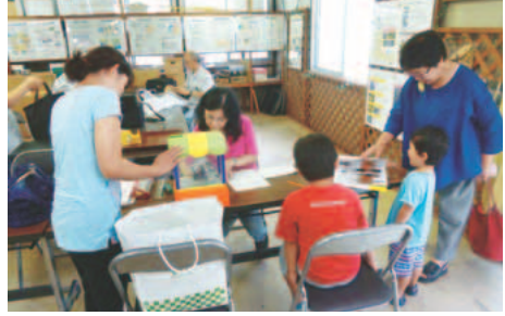
▲「おもちゃの病院」丁寧に診察します

※おもちゃは1組3点まで ※モデルガン等の危険なおもちゃ、中古購入などで最初から壊れていたおもちゃは不可 定20組程度(予約者優先) 費用無料(部品交換の場合は実費負担) 申電話(11月15日(金)～12月11日(水)) フードドライブ