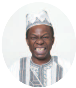
▲オスマン・サンコン氏