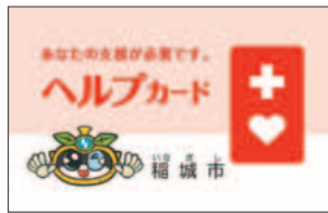
▲詳細が記載されています