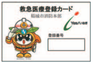
▲救急医療登録カード

あらかじめ、住所・氏名・かかりつけ医療機関・緊急連絡先などを登録します。体調が悪くなり119番通報をする時に登録番号を伝えると、救急車が登録された住所へ出勤し、速やかな医療機関への搬送が行われます。