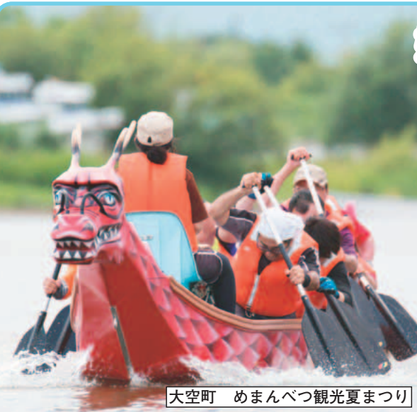
大空町 めまんべつ観光夏まつり

東京ヴェルディ 今月後半のホームゲーム VS 大宮アルディージャ 6月22日(土)午後7時 味の素スタジアム 東京ヴェルディ(株) ☎03・3512・1969