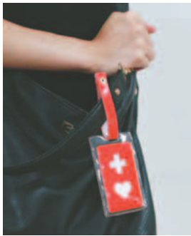
▶見かけたら必要な配慮をお願いします