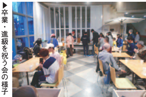
卒業・進級を祝う会の様子