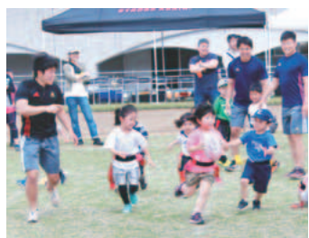
▲タグラグビーを体験

家庭剪定枝リサイクル情報 6月下旬〜7月の作業日・地区 6/25(火)・大丸、7/2(火)・平尾、7/9(火)・百村、7/30(火)・若葉台、全ての作業日・東長沼