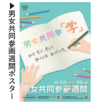
男女共同参画週間ポスター