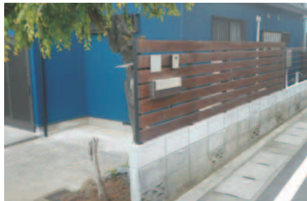
▲工事後のブロック塀

先問 土木課緑と公園係 生垣づくりの補助 市では、生垣の設置費用の一部を補助しています(上表参照)。