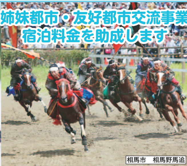
相馬市 相馬野馬追