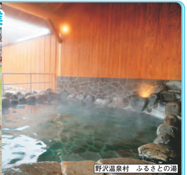
野沢温泉村 ふるさとの湯