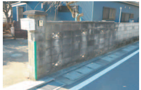
▲工事前のブロック塀