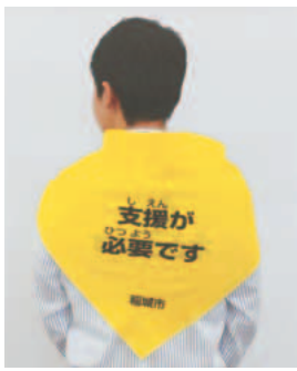
▶肩など目立つ所に着用

「耳が不自由です」「目が不自由です」「身体が不自由です」「支援が必要です」の4種類のメッセージが記され、