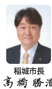
稲城市長 高橋 勝浩