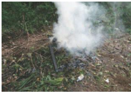
▲野焼きは禁止です

ただし、農地での害虫駆除や神事などの伝統行事による焼却行為は除外されています。その場合でも生活環境への配慮が必要であり、近隣住民か