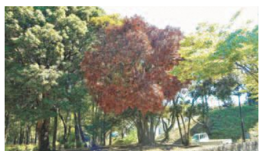
▲平尾近隣公園のナラ枯れしたマテバシイ