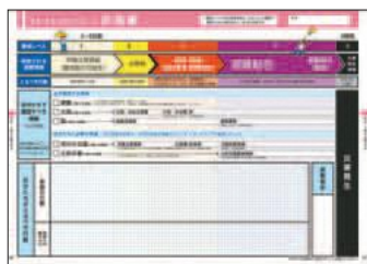
▲いなぎ防災マップの「マイ・タイムラインシート」

いざという時のために、地域の危険な場所・指定避難所・避難行動(マイ・タイムラインで準備)・準備しておく物など、令和2年3月に全戸配布した「いなぎ防災マップ」で確認しましょう。市㊟からもご覧いただけます。