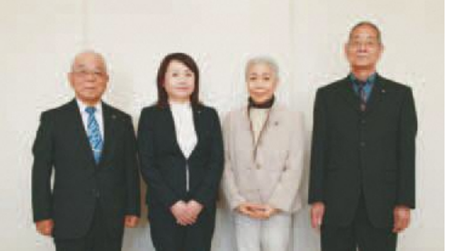
▲左から 柏村氏、千木良氏、渡邊氏、敬子氏