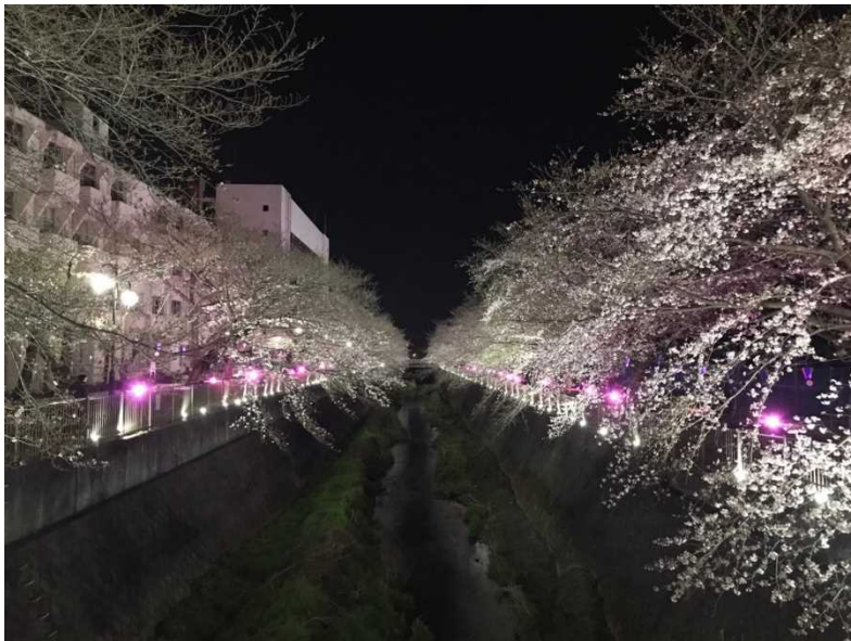
↑ 昨年のライトアップの様子