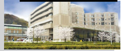
稲城市立病院(大丸1171)