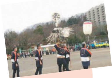
矢野口纏木遣保存会 による木遣り披露