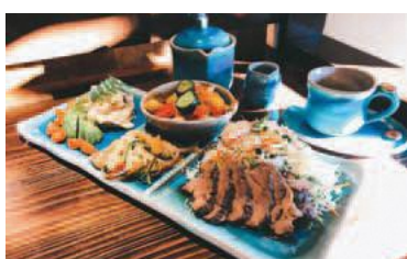
▲おいしい料理で恋を彩ります

稲城市内の商店会散策と飲食パーティーのセットです。京王よみうりランド駅からグループごとに自由に散策し、パーティー会場の「地下DINING&CAFEつどい」まで向かいます。