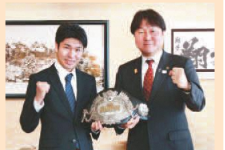
黒田選手は11月10日に行われた試合で2度目の防衛を果たし、チャンピオンベルトを手に表敬訪問に訪れました。