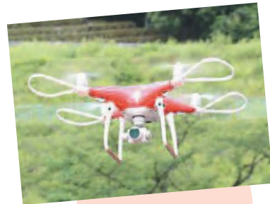
平成29年8月に運用 開始したドローンの 飛行訓練