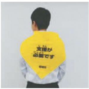
▲支援用バンダナの例

場福祉センター ※新型コロナウイルスの影響で中止となった場合は個別に相談 申電話