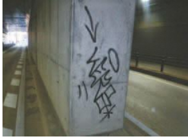
▲上平尾トンネルでの事例