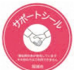
▲ごみ出し支援サポートシール