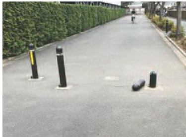
▲三沢川さくら通りでの事例

ご協力ください 公園の利用マナー 市内の公園では、ごみの散乱や、ペットのフン害など、利用マナーに関する苦情が多く寄せられています。迷惑行為などを発見した場合は、(公財)いなぎグリーン