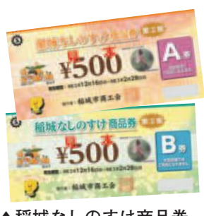
▲稲城なしのすけ商品券 (第2弾)