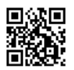
▲スマートフォンの方はこちら

※インターネット上からクレジットカードやネットバンキングを使って簡単に寄付ができます。 ○市立病院管理課窓口で「寄付申込書兼受領書」に必要事項を記入して提出 税制上の優遇措置 寄付者が個人の場合 ふるさと納税の対象となります。寄付金の入金確認後、確定申告時に必要となる「寄付金受領証明書」を送付します。 寄付者が法人の場合 当院への寄付は、法人税法の規定により、寄付金の全額が損金に算入されます。 ㊟市立病院管理課庶務係 ☎377-0931