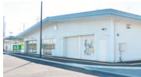
▲稲城長峰スポーツ広場管理棟(4月1日オープン)