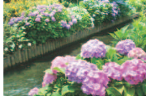
「大丸用水のあじさい」 (稲城市フォトギャラリー投稿作品)