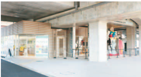
▲いなぎ発信基地ペアテラス(4月23日オープン)

※年度末の3月は、一般会計と特別会計の歳入・歳出予算額が確定します。各会計の収入額と支出額（決算額）は、5月末日に確定します。