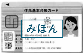
▲住民基本台帳カード（住基カード）

A 過去に発行した電子証明書は有効期限内であれば、マイナンバー制度が始まってからも期限までお使いいただけます。