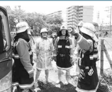
▲整列する消防団員