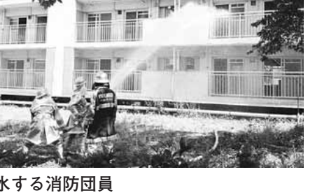
▲放水する消防団員

室内に突入・放水する訓練を、参加した第1、8分団の全団員が体験できました。市では、東日本大震災の発生以来、消防団への各種資機材配備を強化しておりますが、災害対応の力ギとなるのは、やはり熟練した人材です。 日頃自らの仕事をこなしながら消防団に従事してくださる若者が、こうした高度な訓練を通じてさらにスキルを上げていくことは、市民にとっても心強い限りです。