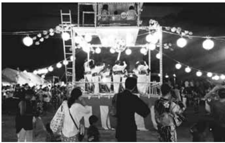
▲昨年の盆踊りの様子(百村)