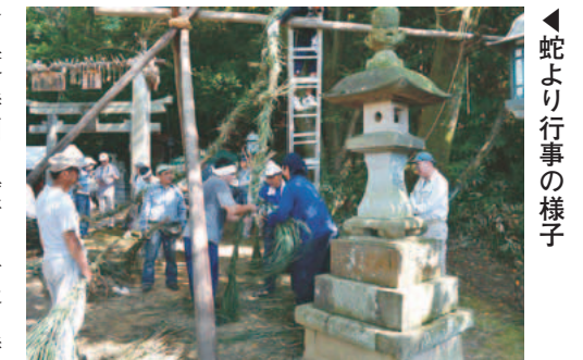
▲蛇より行事の様子