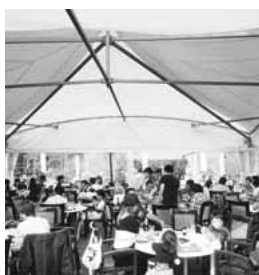
▲家族慰安会の様子

6月7日によりうらランドで、日頃より消防団活動にご理解とご協力をいただいているご家族に対し、感謝の意を込めて家族慰安会を実施しました。 当日は天候にも恵まれ、約210人と多くの消防団員とご家族にご参加いただきました。 今後ともご家族の協力のもと、消防団員は稲城市民の安全・安心を守るために、消防・防災活動に全力で取り組めます。