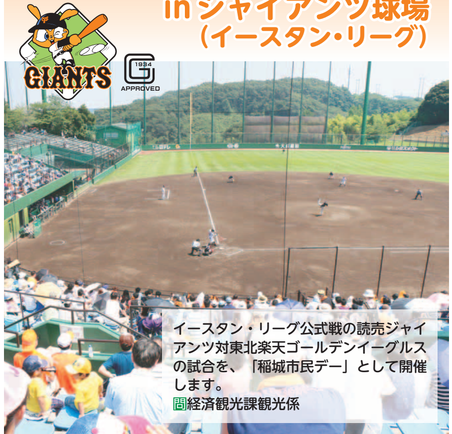
イースタン・リーグ公式戦の読売ジャイアンツ対東北楽天ゴールデンイーグルスの試合を、「稲城市民デー」として開催します。 経済観光課観光係