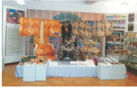
▲郷土資料室（ふれんど平尾内）

今回の「手作りアイスクリーム、動物ふれあいコース」では若葉台駅から坂浜・平尾地区まで、自然や動物との触れ合いを楽しみながら散策するコースです。「稲城の太鼓判」に認証されたアイスクリームや天然酵母を使用したパンなどのお買物をしながら、稲城の歴史と自然を味わいます。案内チラシについている応募はがきに、4つの稲城なしのすけスタンプを集めて応募すると、抽選で50人に稲城の美しいお土産が当たります。スマートフォン専用アプリ「ふらっと案内」からも応募できます。