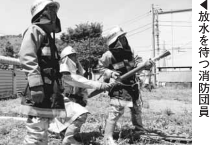
▲放水する消防団員

実は、現在高層化して建替えが完了している都営大丸アパートの工事着手前に、今回と同様に取壊し予定棟を借り受けて訓練をしたことがあったようですが、その当時は破壊や放水はできなかったとのことでした。 しかし、今回は取壊し予定棟の使用について特に条件はなく、訓練に必要な範囲であれば破壊や放水も可能とのことでした。 訓練の想定は2階部分の居室から出火、南側ベランダ方向からの放水と北側玄関ドアを破壊・突入して放水するという実践的なものでした。鉄製の玄関ドアを各分団に配備されているエンジンカッターで焼き切ったうえで鍵を解除し、階段から消火ホースを延長して