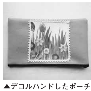
▲デコルハンドしたポーチ