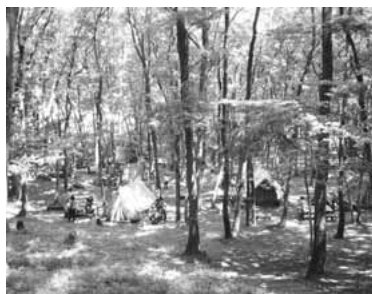
▲稲城ふれあいの森テントサイト

稲城ふれあいの森で、家族キャンプ(宿泊)ができます。野外活動や散策、自然観察など、ご家族一緒に豊かな自然を満喫しませんか。