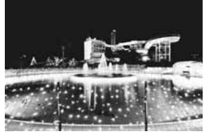
「稲城の光」 (稲城市フォトギャラリー投稿作品)