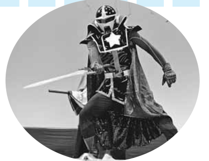
▲一日救助隊長の「カツキング」

市では例年、地域防災訓練を実施していますが、本年度は5年に1度の総合防災訓練を開催します。今回は、地震災害だけではなく、土砂災害や洪水等も含めた総合的な災害に対応することができる訓練を計画しています。更に、小さなお子さんも楽しんで学べる訓練を準備していますので、皆さんの参加をお待ちしています。