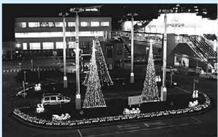
▲イルミネーションの様子

点灯期間 11月15日(土)～平成27年1月13日(火) 主若葉台駅前イルミネーション