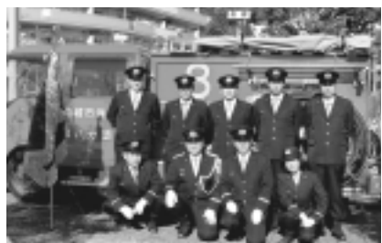
ニュータウンで活動する第八分団の皆さん

どで、災害時は多くの分団員がすぐに集まり活動を行うと思われていますが、私たち第八分団は100%サラリーマンで普段は地元に分団員はおりません。したがって活動時間は平日の夜間と週末や祝日を中心となります。