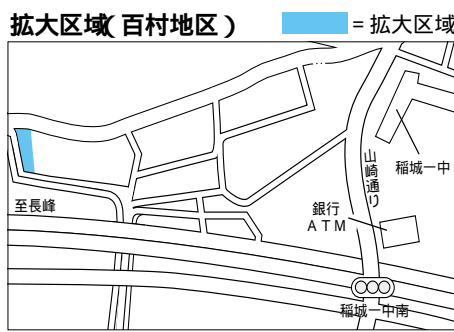
武線・三駅整備係

下水道本管工事が完了したことで、9月1日から百村地区の一部で新たに下水道が使用できるようになりました。