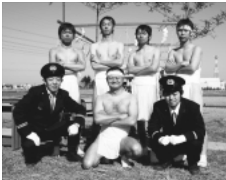
櫻神事を務めた稲城多摩川水神祭(1月17日)