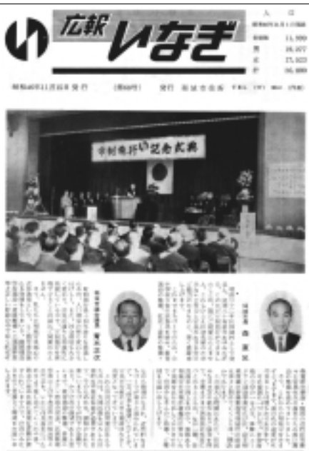
図2 市制施行後最初の「広報いなぎ」