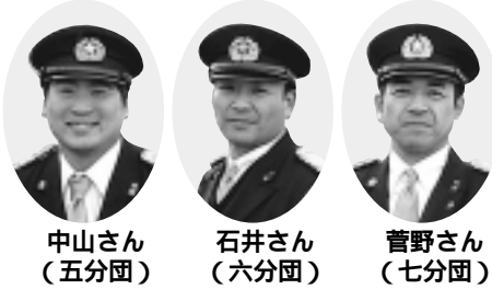
写真は、団長・分団長時のものです。