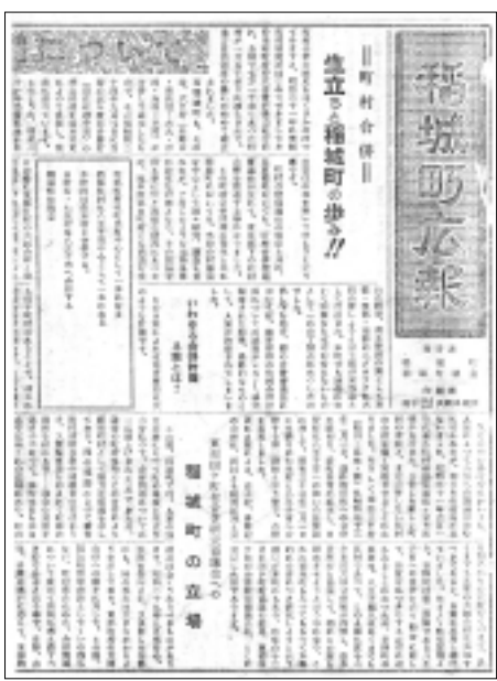
図1 広報いなぎの創刊号「稲城町広報」