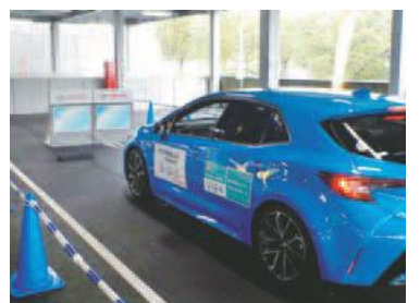
▲セーフティサポートカー乗車体験

9月22日(火・祝) 時 午前10時～正午 場 コーチャンフォー若葉台店 内 パトカー・白バイの乗車体験、ミニ信号機による交通安全教室、シートベルトコンビンサーの乗車体験、セーフティサポートカーの乗車体験など