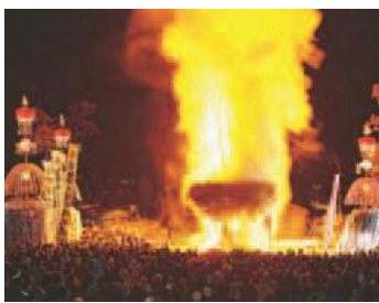
▲野沢温泉村(道祖神祭)

いても検討することを要望する」との提言を受けました。この提言に基づき相馬市・野沢温泉村と友好都市提携を締結するとともに、「稲城市海外姉妹都市提携検討市民会議」を設置し、海外都市との交流事業について意見交換したところ、海外姉妹都市提携を行うことについて一致しました。