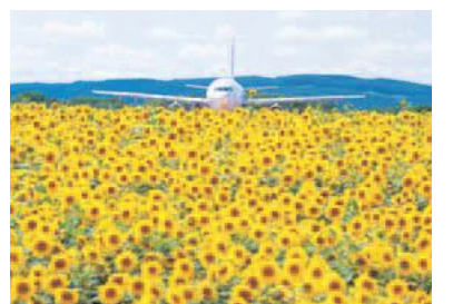
▲大空町(女満別空港)

市民参加により検討され発足する本交流協会が、市民主体の運営により発展を遂げ、姉妹都市・友好都市とのつながりが一層深まりますことを期待しています。