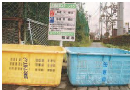
▲資源回収ステーション

台風・強風などの悪天候により、資源回収ステーションに設置したかごが飛散する恐れがある時は、回収を中止する場合があります。 その際は、次の回収日まで自宅で保管してください。また、回収を実施する場合でも、飛散などの可能性があるため、当日の朝に出してください。