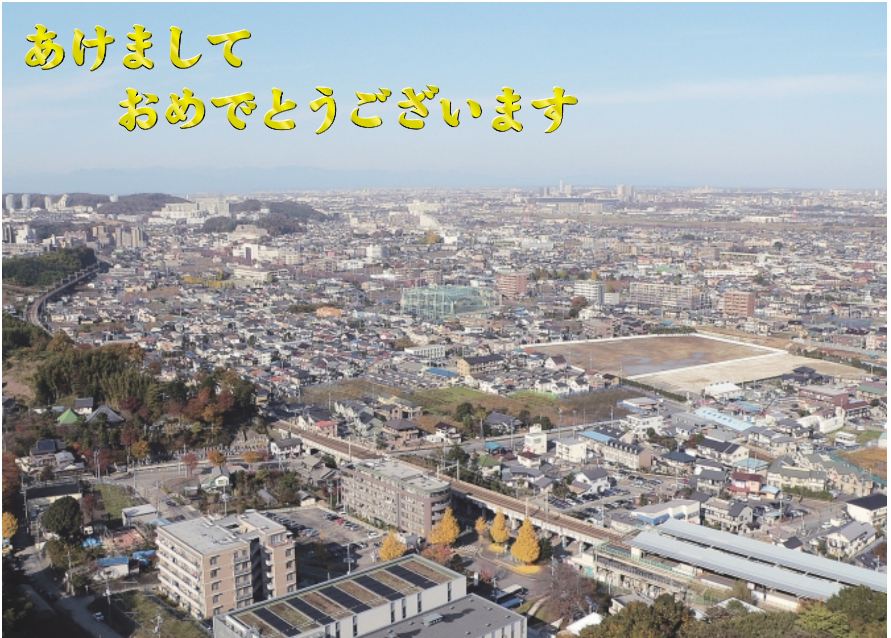
よみうりランドタワーから