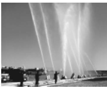
出初式の一斉放水

市民の生命・身体及び財産を守り、災害のない明るいまちを目指して、消防出初式を行います。消防部隊