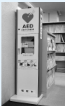
市役所1階総合案内横に設置されたAED