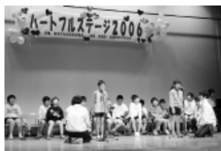
ハートフルステージ2006(2月3日・中央文化センター) 市内の障害者関係施設の利用者や稲城第三小学校いなほ学級、平尾小学校なかよし学級、稲城第一中学校五組の皆さんが楽器の演奏や歌などを元気いっぱい披露し、観客の皆さんは温かい声援を送っていました。主催 社会福祉協議会。