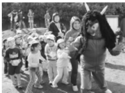
豆まき集会(2月3日・市立第二保育園) 「鬼は外! 福は内!」子どもたちは、一年間みんなが幸せに暮らせるようお願いを込めて、大きく元気な声で豆まきをし、鬼を追い払いました。