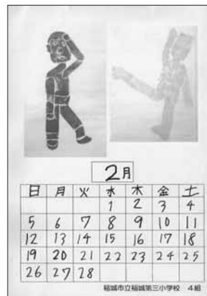
稲城市立稲城第三小学校4組の皆さんの作品です。

編集・発行 稲城市教育委員会教育部生涯学習課 〒206-8601 稲城市東長沼2111 ☎042-377-2121 042-379-0491