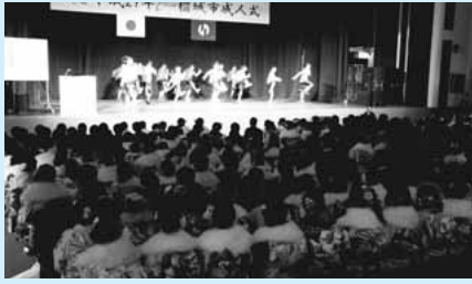
▲オープニングアトラクションの様子

1月9日(月・祝)によりランドロイドテレららんホールで成人式を開催しました。当日は、611人(市外在住者38人含む)の新成人が参加し、大人の仲間入りをした喜びを分かち合いました。