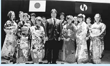
▲市長と成人式実行委員