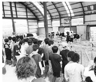
▲大空町での畜産体験