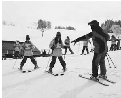
▲インストラクターによるスキースキーの指導①