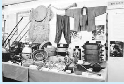
▲郷土資料室の民具資料

江戸時代に建てられた平尾古民家の母屋と土蔵の一般公開を実施します。3月の回では、あ