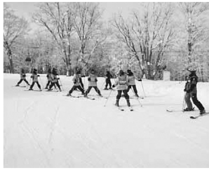
▲インストラクターによるスキースキーの指導②