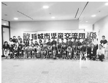
▲女満別空港での歓迎

稲城市大空町教育交流を経験した子どもたちが、固い絆で結ばれているように、今後も稲城市と大空町の結び付きが一層深まることを願っています。