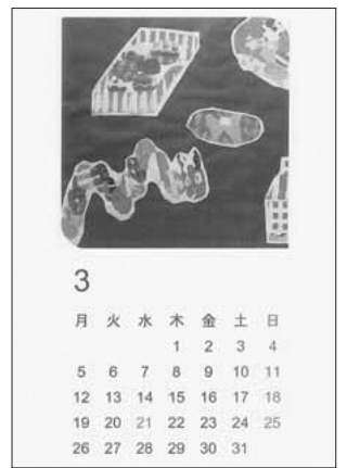
稲城市立平尾小学校なかよし学級の皆さんの作品です。

編集・発行 稲城市教育委員会教育部生涯学習課 〒206-8601 稲城市東長沼2111 ☎042-377-2121 042-379-0491