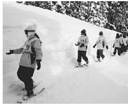
▲スノーシューで雪山を散策

体験学習では、圧雪していない雪の上や山の中の雪道をスノーシューをはいて歩いたり、観光地として有名な野沢温泉スキー場でインストラクターがついた2日間のスキー実習をしたりしました。また、雪遊びや寒さから身を守るための工夫など、雪国ならではの生活体験、そして道祖神御神体作り・餅つきなどの民宿での交流活動を通し、生徒たちは、自然の厳しさとすばらしさ、スポーツの楽しさ、伝統・文化を理解し伝えていく意義を実感するとともに、野沢温泉村の人々のおもてなしの精神に触れ、多くのことを学びました。